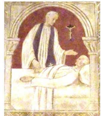
Cathédrale Sainte-Geneviève de Nanterre

Inscriptions à la journée des malades samedi 12 février 2022 Église Saint-Jean-Baptiste