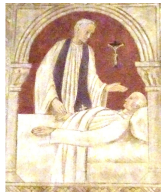
Cathédrale Sainte-Geneviève de Nanterre

- Un accompagnement en voiture ou à pieds est prévu, à demander lors de l'inscription. Que les personnes disponibles se fassent connaître !