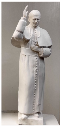
esquisse de la statue par Dan Robert

Nous continuerons de porter les intentions qui lui sont confiées tous les 3 èmes jeudis du mois à 19h à Bienheureuse-Isabelle et les 22 de chaque mois à 12h15 à Saint-Jean-Baptiste.